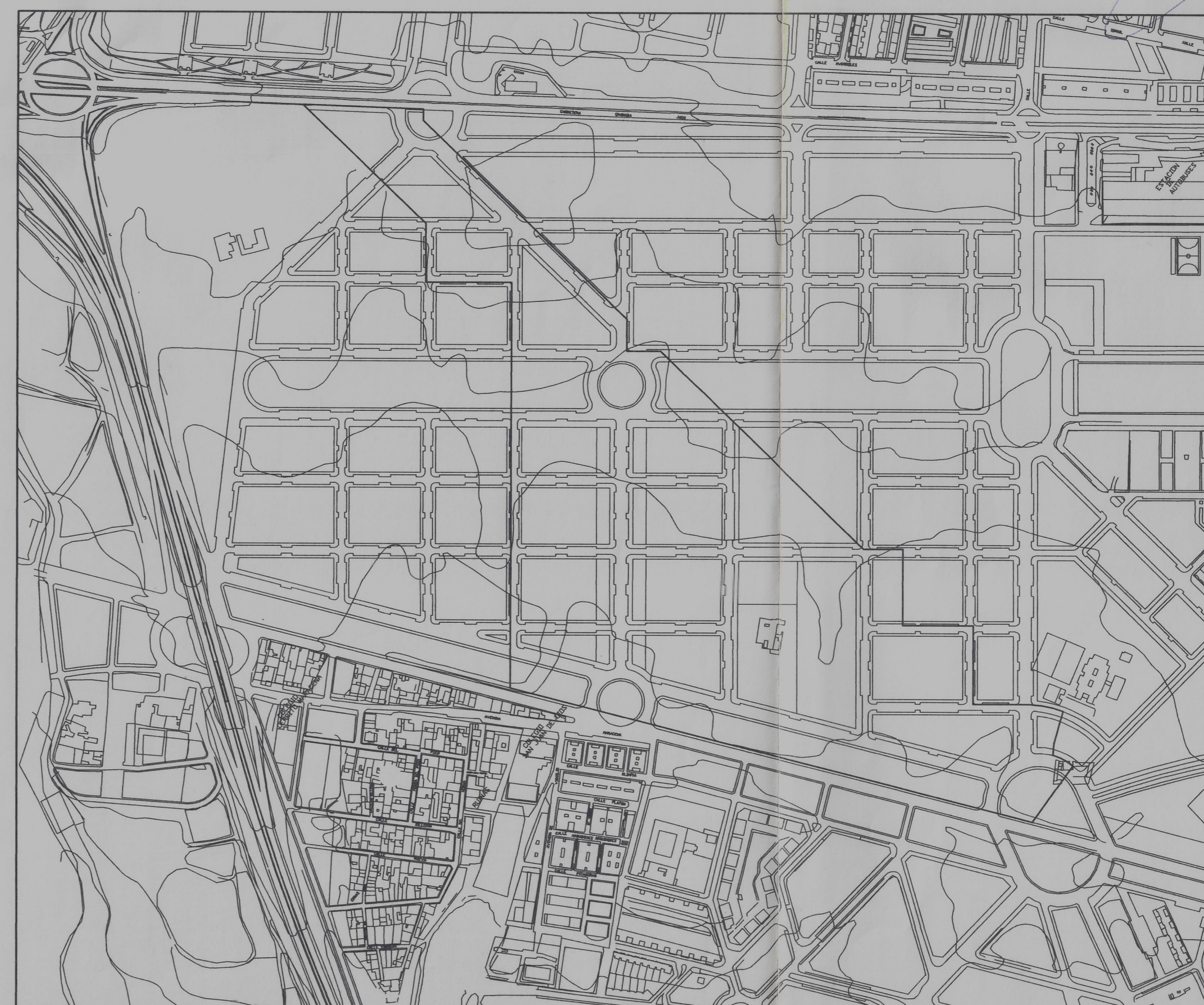
ORDENACION DE PROYECTO