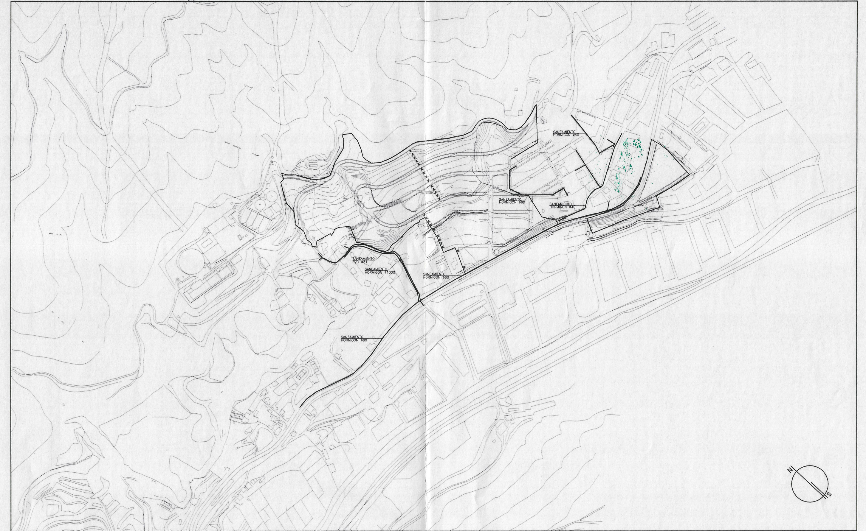
SANEAMIENTO Y ALCANTARILLADO